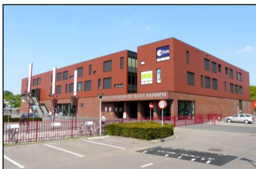
Winkelcentrum De Rooij Pannen