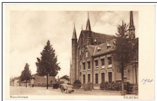
Ansichtkaart van pastorie en kerk anno 1920 Hasseltstraat 194 (bron: Beeldbank Regionaal Archief Tilburg).

Voor uw dagelijkse boodschappen kunt u terecht bij de winkels aan de Jan Heijnstraat (o.a. Albert Heijn-XL) of bij de winkels aan het Bart van Peltplein (o.a. Jumbo). Tevens vindt u in de nabij gelegen Goirke- en Hasseltstraat verschillende winkels.